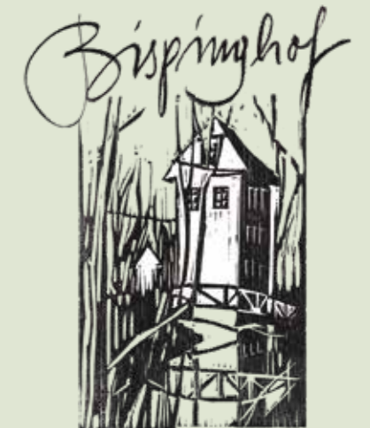
Förderverein Bispinghof e.V.