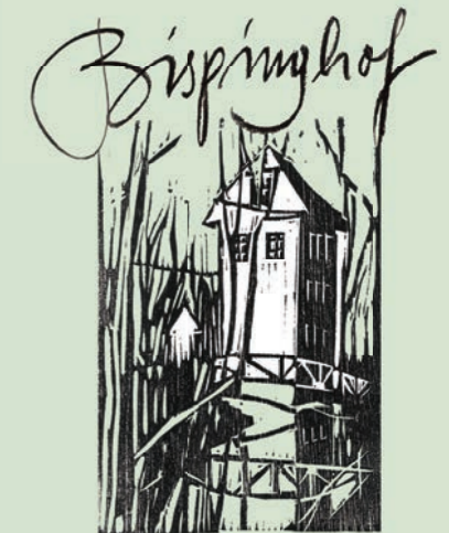
Förderverein Bispinghof e.V.